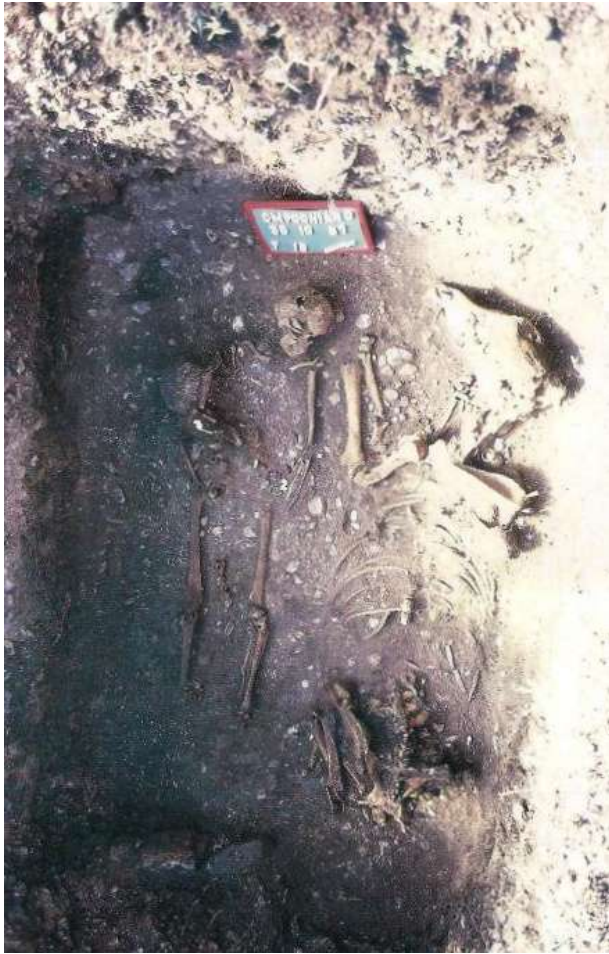
Fig. 5 - Tomba a fossa di cavaliere con cavallo - Vicenne VI sec. d.C.