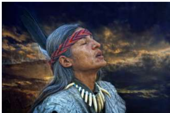
Fig. 2 - Lo Sciamano

“gruppo”, perché egli può agire per conto del suo clan, della tribù o più in generale per i singoli individui, di qualunque clan o tribù, che chiedano il suo intervento.