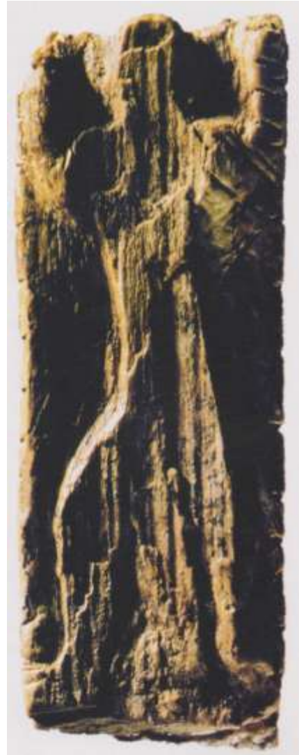
Fig. 1 - Sciamano - Germania 330.000 a.C. (Marzatico)

"ricordo" presente nei territori subpolaroasiatici (come in altre parti del mondo), possa essere la stessa da cui è nata la classe dei guerrieri.