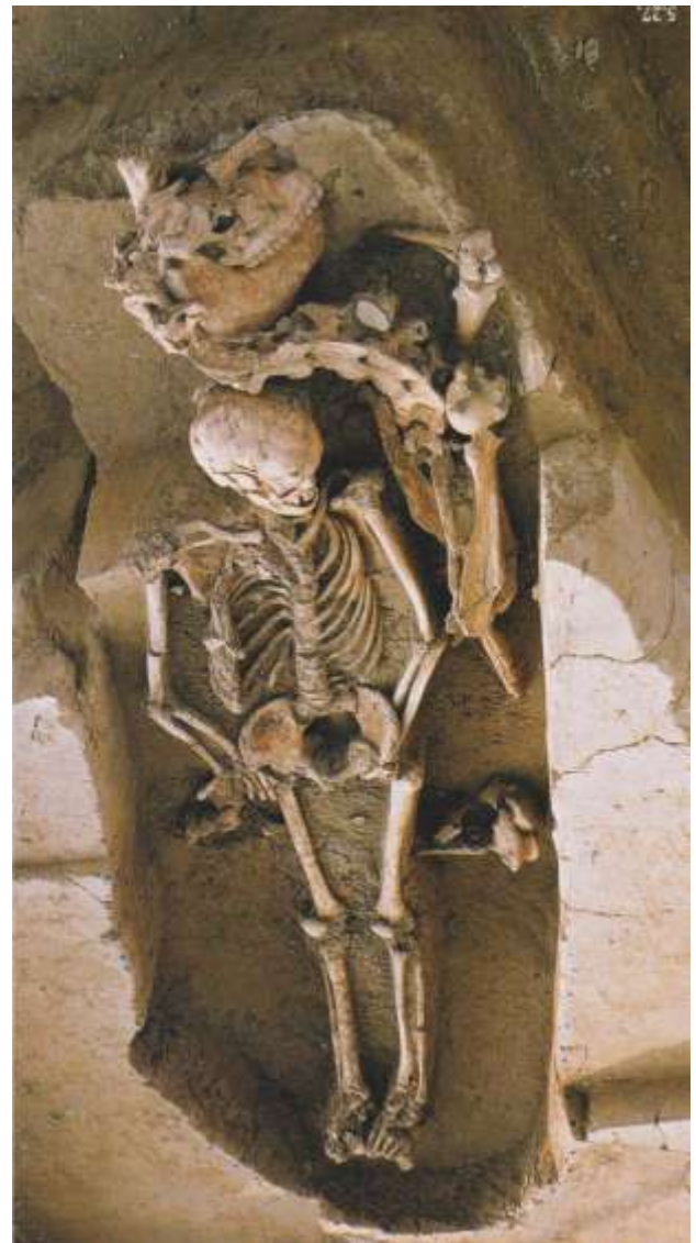
Fig. 4 - Tomba a fossa di cavaliere con cavallo – Padova V sec. a.C. (Marzatico)

la pressione esercitata sulle tribù minori determinerà le cosiddette “invasioni barbariche” ed il passaggio in Europa occidentale di quella che potremmo chiamare “l'ideologia cavalle-resca”.