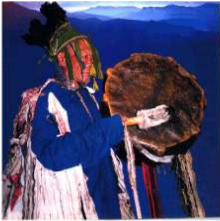
Fig. 3 - Sciamano della tribù Nency con il suo tamburo

Il tamburo deve corrispondere a specifiche caratteristiche: presso gli Yakuti 26 il legno deve essere di un larice di otto rami (otto è un numero sacro nell'ambito sciamanico) che sia rivolto verso est, punto cardinale positivo per gli Yakuti (ma non per tutti i popoli delle steppe), e la sua pelle è di un animale che deve avere tre anni (più raramente si parla di due o di quattro anni). Una volta costruito, il tamburo deve essere "animato" e vi sono canti specifici per questo rito, ad esempio presso gli Yakuti: "Trasformo il tamburo rotondo, ne faccio un cavallo possente / trasformo e creo dal tamburo un cavallo veloce" ; una volta animato, il tamburo-cavallo deve essere domato: "Ti ho proprio superato, ti ho vinto, tamburo! / ... Sei definitivamente un caval-